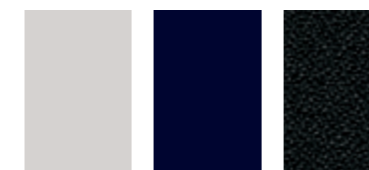
Blanc Banquise Bleu impérial Noir Onyx